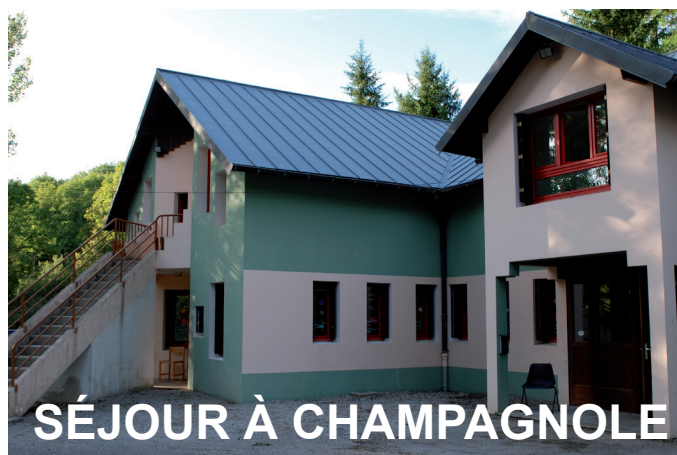
SÉJOUR À CHAMPAGNOLE