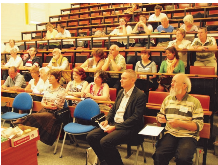
Une partie de l'auditoire